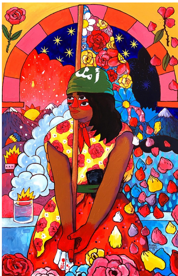
Ricardo Cavolo - Zahara 2017 www.ricardocavolo.com

Con questo numero della newsletter modifichiamo leggermente il suo formato e la periodicità. Come avrete sicuramente notato non sempre siamo riusciti ad inviare le comunicazioni mensilmente, quindi da questo numero l'uscita sarà periodica cercando di essere puntuali ogni mese per darvi informazioni fresche.